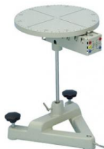
Table tournante avec moteur d'entraînement

Pour les expériences qui nécessitent une rotation régulière et dont les angles doivent être mesurés sur un enregistreur ou une interface (CASSY), par exemple lors d'expériences sur la diffraction (ultrasons) ou sur la distribution des angles (micro-ondes). La table est actionnée par un moteur à courant continu à engrenage et une roue à friction ; le mouvement rotatif est enregistré par une seconde roue à friction et un potentiomètre hélicoïdal 5 tours. L'angle de rotation est proportionnel à la variation de la résistance. La table est graduée tous les 5° et présente une perforation centrale de 4 mm.